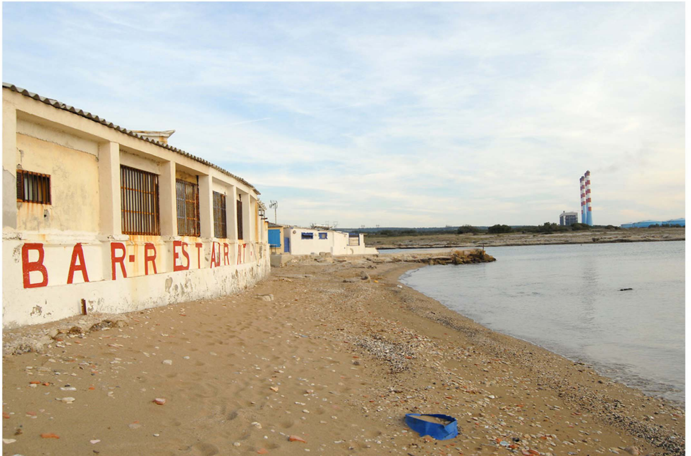
Sans titre 2009